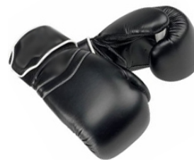
Gants de BOXE Uniquement pour les POUSSINS à BENJAMINS