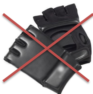
Gants de sac : Trop fin