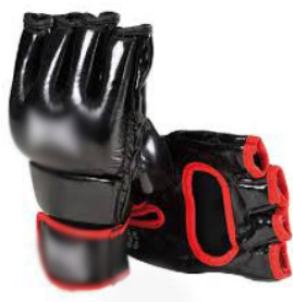
MITAINES Uniquement pour les Minimes à Vétérans