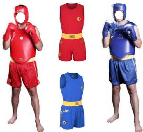
Exemple de tenues et protections conforme (Combattant Sénior SANDA Masculin)

Les genouillères et coudières éventuelles ne devront pas contenir d'autre matière que du tissu.