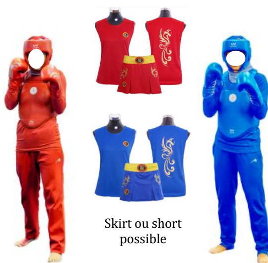
Exemple de tenues et protections conforme (Combattante Sénior SANDA Féminine)