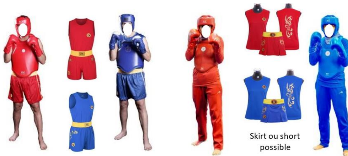
Exemple de tenues et protections conformes (Combattant Sénior SANDA Masculin)